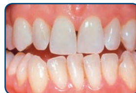
Resultaat na tien dagen bleken met de thuisbleekmethode onder supervisie van de tandarts