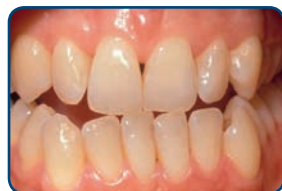
Voor het bleken

De lengte van een bleekbehandeling hangt af van de bleekmethode. Bij de thuisbleekmethode duurt het meestal twee tot drie weken voordat je het gewenste resultaat hebt bereikt. De tandkleur wordt na het beëindigen van de bleekbehandeling altijd weer iets donkerder. Na zes weken kun je pas het echte bleekresultaat zien.